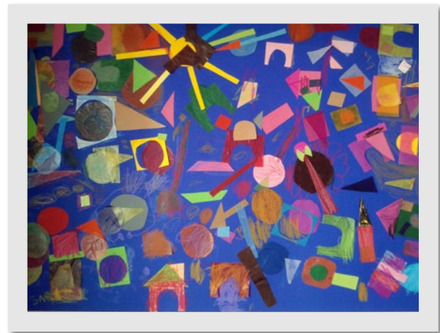
Kreativ in Berg am Laim

Mehr Informationen zu dem Projekt erhalten Sie bei Christa Maier-Matschke , Stadtteiltreff Berg am Laim, Gotteszeller Straße 18, Tel. 45 08 82 23 stadtteiltreff@mags-muenchen.de