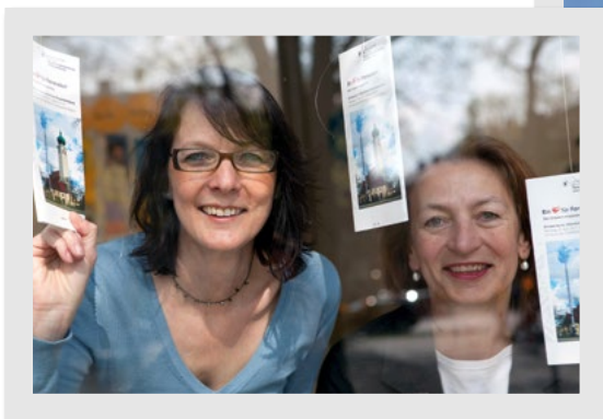
Quartiersmanagement weiterhin ansprechbar in Ramersdorf

In dieser Ausgabe wollen wir Ihnen zwei interessante neue Projekte vorstellen und auf den Tag der Städtebauförderung hinweisen, der die Gelegenheit bietet, sich mal wieder vor Ort ausgewählte Projekte der Sozialen Stadt in RaBaL anzuschauen.