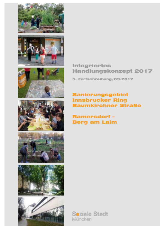
Integriertes Handlungskonzept 2017 5. Fortschreibung/03.2017

Das Handlungskonzept und mehr Informationen zu allen Projekten der Sozialen Stadt Ramersdorf/ Berg am Laim finden Sie auf der Homepage www.soziale-stadt-rabal.de . Dort finden Sie auch das Antragsformular für Projekte aus dem Verfügungsfonds – bis zu 2.600 € pro Projekt (und maximal 8.500 für einen erweiterten Verfügungsfonds Antrag) können Sie bei der Sozialen Stadt beantragen. Für weitere Fragen stehen wir Ihnen telefonisch unter der 089 / 452 18 900 zur Verfügung oder Sie besuchen uns im Stadtteilladen baum20.