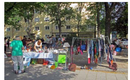
der Flohmarkt am Karl-Preis-Platz