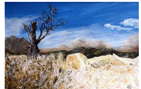
Eines der Bilder von Horst Schuster

Mo, 24.04.2017, 18.00 Uhr Ludwig Thoma Realschule, 1. Stock im Mensagebäude