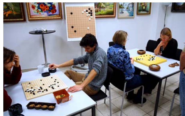
... seine MitspielerInnen in baum20