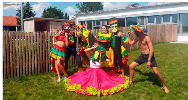
Die Tanzgruppe mit ihren Kostümen in Aktion